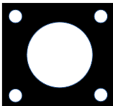
Le socle de fixation