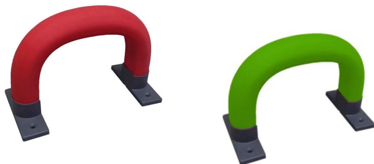
CAS N°1 : DEUX DISPOSITIFS DE RAPPEL SONT NÉCESSAIRES