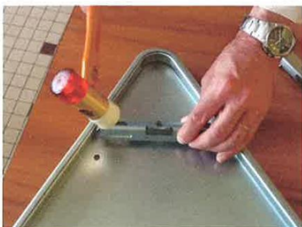
② Puis la frapper d'un coup sec