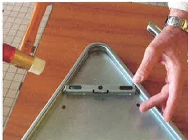
③ Montage réalisé